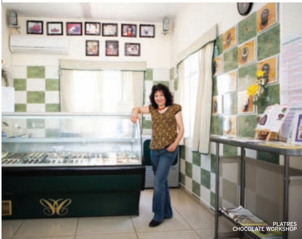
PLATRES CHOCOLATE WORKSHOP